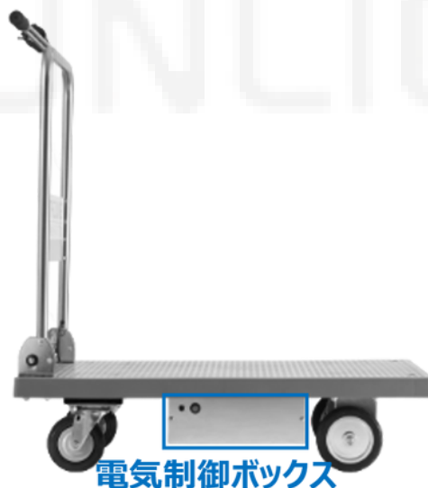
電気制御ボックス